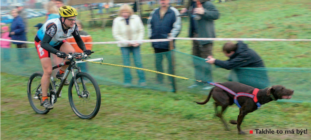
■ Takhle to má být!