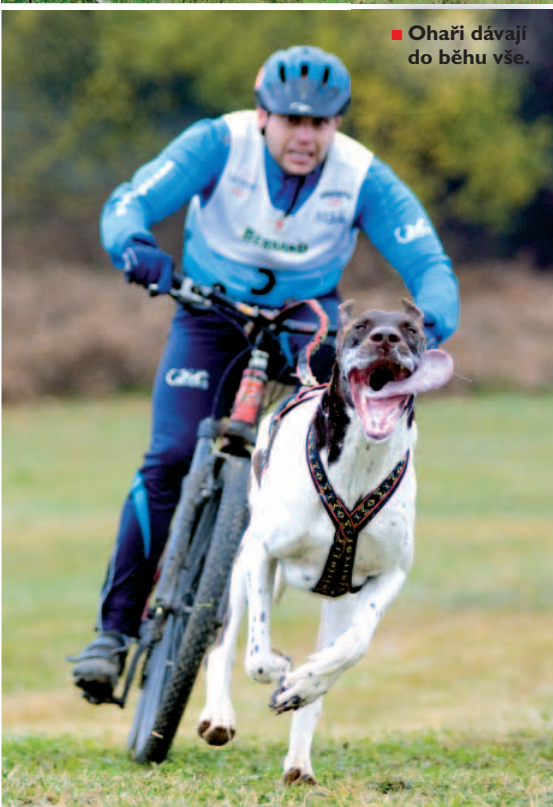
■ Ohaři dávají do běhu vše.