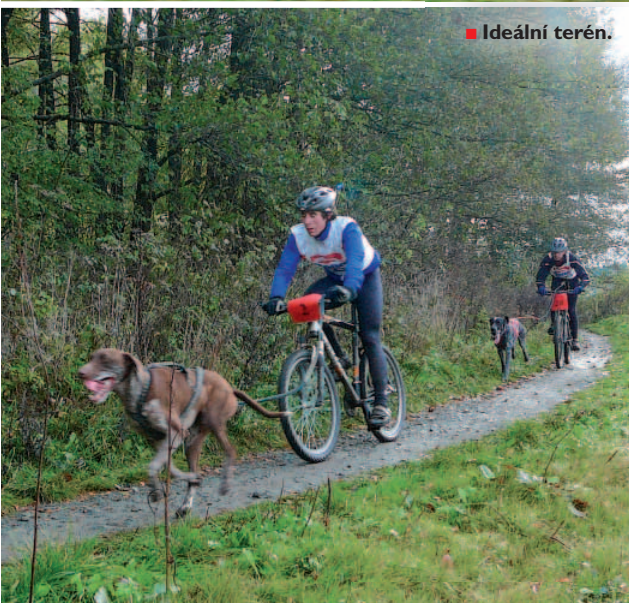
■ Ideální terén.