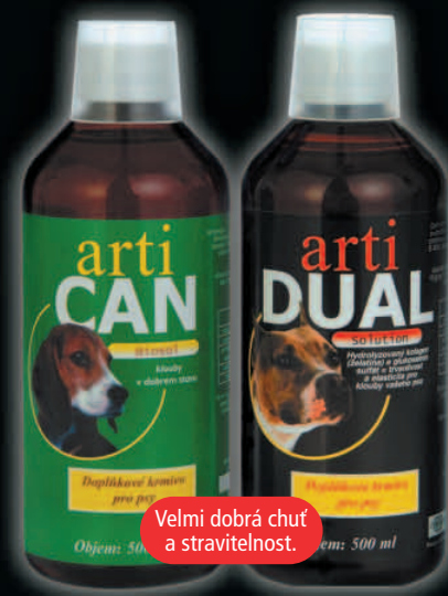
Velmi dobrá chuť a stravitelnost.