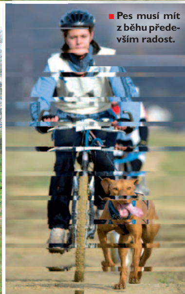
■ Pes musí mít z běhu především radost.